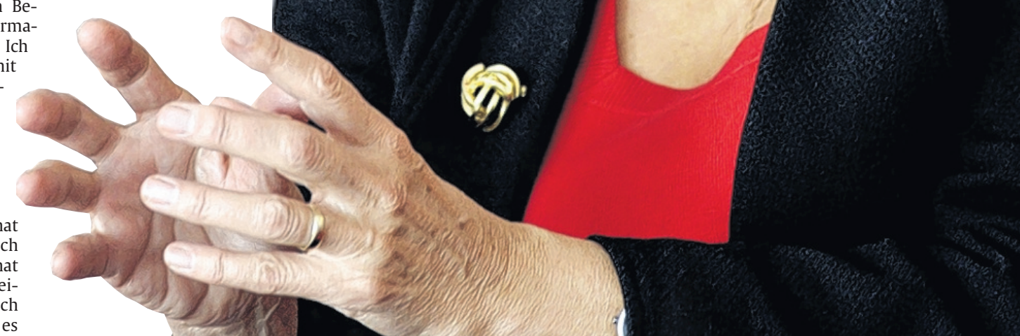
„Das fehlende Einfühlungsvermögen ist auch eine Ursache für die Krise.“ Gesine Schwan im AZ-Interview.